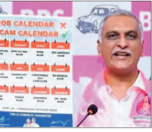
రేవంత్ రెడ్డి ఏనాడూ ఉద్యమంలో లేదు

మొదటి పేజీ తరువాయి అమలు చేస్తున్నారని బీఆర్ఎస్ఎల్పి డిప్యూటీ ఛీఫ్ లీడర్ హరీశ్ రావు అన్నారు. గురువారం ఆయన తెలంగాణ భవన్లో మీడియాతో మాట్లాడారు. రేవంత్ రెడ్డి జాబ్ క్యాలెండర్ ఇవ్వలేదు కానీ స్కామ్ క్యాలెండర్ మాత్రం ఇచ్చారని ప్రతినెలా ఉద్యోగాలు భర్తీ చేస్తానని చెప్పి, నెలకు ఒక స్కామ్ చేశారని ఆరోపించారు. జనవరిలో సివిల్ సప్లై స్కాం, ఫిబ్రవరిలో ఎన్టీసీపీ పై యాక్ట్ స్కాం, మార్చిలో సాండ్ స్కాం, ఏప్రిల్లో ఆర్టీసీ స్కాం, మేలో బామ్మర్తికిచ్చిన అమ్మత్ తండర్ల స్కాం, జూన్లో ఫోర్ట్ సిటీ స్కాం, జూలైలో లగచ్ఛర్, హైదరాబాద్ సెంట్రల్ యూనివర్సిటీ ల్యాండ్ స్కాం, ఆగస్టులో షీజీ మెడికల్ సీట్ల స్కాం, సెప్టెంబర్లో హిల్స్ బి ఇండస్ట్రీయల్ స్కాం, అక్టోబర్లో పవర్ స్కామ్, నవంబర్లో సింగరేణి స్కాం, డిసెంబర్లో సీఎం, కేఎల్ఎస్ఆర్ స్కాం అమలు చేశారని పేర్కొన్నారు. ఆరు గ్యారంటీలకు దిక్కులేదు కానీ, రేవంత్ పాలనలో నెలకొక స్కాం మాత్రం పక్కా జరిగిందన్నారు.