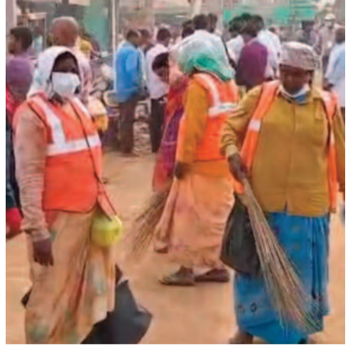
ఉంటూ మేడారాన్ని పరిశుభ్రంగా ఉంచుతున్నారు.

జాతర పరిశుభ్రతే లక్ష్యంగా 5 వేల మంది సైన్యం నిత్యం 24 గంటల పాటు పాలిశుద్ధ్య విధుల్లో సిబ్బంది గద్దెల ప్రాంగణం నుండి రహదారుల వరకు అడుగుడుగునా క్లీనింగ్, జ్లీచింగ్ పనులు నిరంతరం పర్యవేక్షణలో ఎంపీడీవోలు, కార్యదర్శులు వ్యాధుల నివారణకు పెద్దపీట