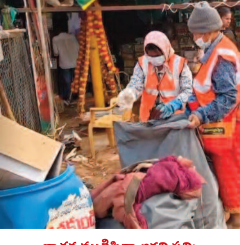
జాతర ముగిసినా ఆగని పని:

అమ్మవారి గద్దెల ప్రాంగణం, విఠపి నివాసాలు, రహదారులు మరియు వేలాదిగా ఉన్న మరుగుదొడ్లను ఎప్పటికప్పుడు శుభ్రం చేయడంలో సిబ్బంది అంకితభావంతో పనిచేస్తున్నారు. తెలంగాణ మరియు ఆంధ్రప్రదేశ్ రాష్ట్రాల నుండి వచ్చిన ఈ హెల్త్ శానిటేషన్ వర్కర్లను డిపిఓలు, ఎంపీడీవోలు మరియు పంచాయతీ కార్యదర్శులు నిరంతరం సమన్వయం చేస్తున్నారు. చెత్తను సేకరించడమే కాకుండా, దానిని వేరు చేసి ప్రత్యేక ట్రాక్టర్ల మరియు ట్రాలీ ఆటోల ద్వారా తరలిస్తున్నారు.