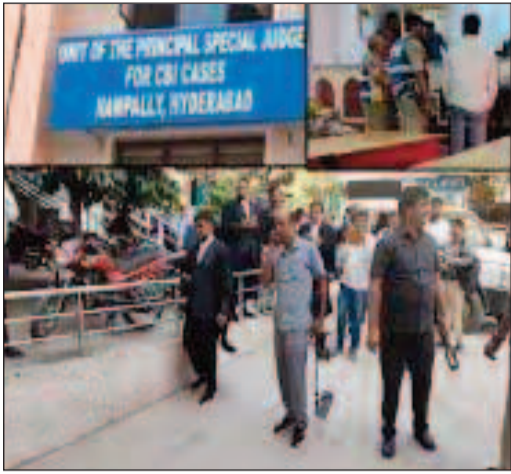
బాంబు ఆచూకీ లభ్యం కాలేదు. దీంతో ఈ ఘోస కాలే

తెలంగాణ బ్యూరో, ఫిబ్రవరి 18 (తీవ్రార్ న్యూస్): తెలుగు రాష్ట్రాల్లోని పలు కోర్టులకు బుధవారం బాంబు బెదిరింపులు వచ్చాయి. హైదరాబాద్ లోని నాంపల్లి, కరీంనగర్, రాజమహేంద్రవరం, అనంతపురం కోర్టులకు ఈ బెదిరింపులు వచ్చాయి. దాంతో ఆయా కోర్టుల్లో బాంబ్, డాగ్ స్వామ్ బృందాలతో పోలీసులు తనిఖీలు చేపట్టారు. తూర్పుగోదావరి జిల్లా రాజమహేంద్రవరం కోర్టుకు బుధవారం బాంబు బెదిరింపు కాలే వచ్చింది. దీంతో కోర్టు సిబ్బంది శ్రీ టౌన్ పోలీసులకు సమాచారం అందించారు. దాంతో కోర్టు ప్రాంగణంలో బాంబు, డాగ్ స్వామ్లతో పోలీసులు ముమ్మర తనిఖీలు చేపట్టారు. ఈ బాంబు కాలే రావడంతో న్యాయవాదులు, కక్షిదారులను కోర్టు ప్రాంగణం నుంచి పోలీసులు బయటకు పంపేశారు. అలాగే ఈ కాలే ఎక్కడి నుంచి వచ్చిందనే కోణంలో దర్యాప్తు చేస్తున్నారు. మరోవైపు కోర్టులో ఎక్కడా