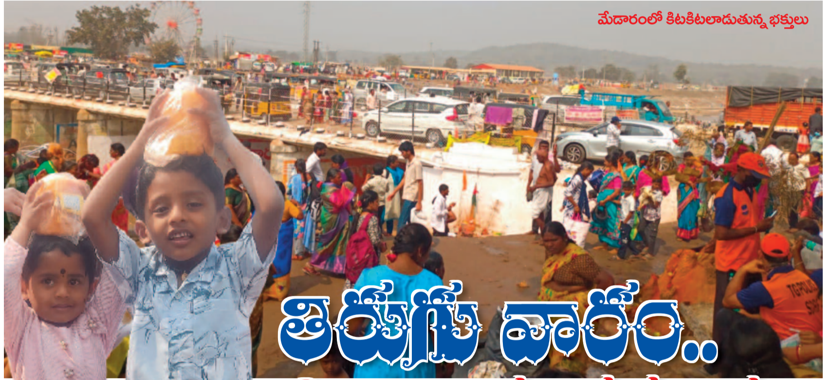
మేడారంలో కిటకిటలాడుతున్న భక్తులు