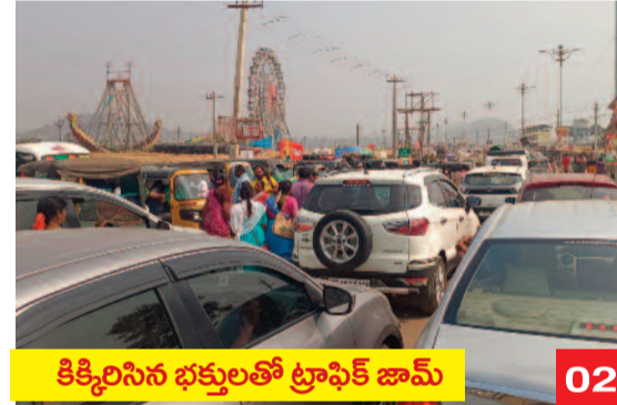
కిక్కిరిసిన భక్తులతో ట్రాఫిక్ జామ్

వాహనాలతో నిండిపోయిన ప్రధాన రహదారులు నియంత్రణలో నిమగ్నమైన పోలీసులు నిలువెత్తు బంగారం సమర్పించి మొక్కలు చెల్లించుకున్న భక్తజనం