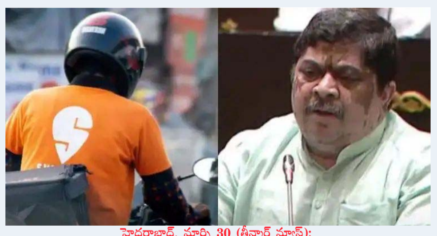
హైదరాబాద్, మార్చి 30 (తీనూర్ న్యూస్): గిగ్ వర్కర్స్ బిల్లుకు తెలంగాణ శాసనసభ ఆమోదం తెలిపింది. శాసనసభలో గిగ్ వర్కర్స్ బిల్లుపై చర్చలో మంత్రి పొన్నం ప్రభాకర్ మాట్లాడారు. శాసనసభలో మంత్రి వివేక్ వెంకట్రామ్ గిగ్ వర్కర్స్ బిల్లును తేవడం సంతోషంగా ఉంది. మా నాయకుడు రాహుల్ గాంధీ భారత్ జోడోయాత్రలో గిగ్ వర్కర్స్ తో సమావేశం నిర్వహించారు. లక్షల మంది గిగ్ వర్కర్లు ఈ బిల్లు కోసం ఎదురు చూస్తున్నారు. ఈ బిల్లులో వృత్తిపరంగా - మగతా2లో