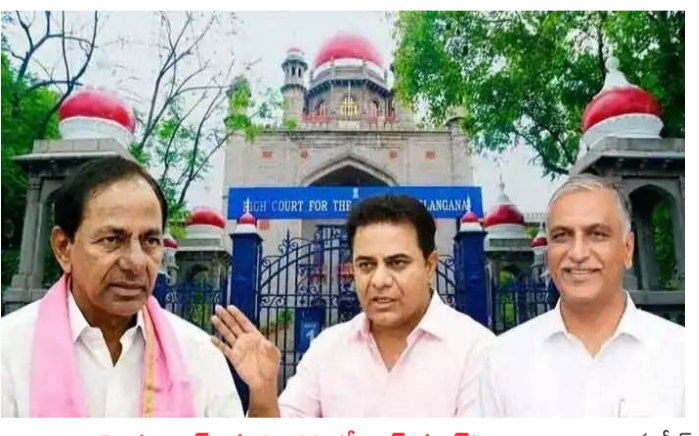
హైదరాబాద్, మార్చి 30 (తీనూర్ న్యూస్): తెలంగాణ రాష్ట్ర సాధన పోరులో అత్యంత కీలకమైన మిలియన్ మార్చి సందర్భంగా తమపై నమోదైన క్రిమినల్ కేసులను కొట్టివేయాలని కోరుతూ మాజీ సీఎం కేసీఆర్, ఓటీఆర్ వర్గం ప్రెసిడెంట్ కేటీఆర్, మాజీ మంత్రి

హైకోర్టును ఆశ్రయించిన కేసీఆర్, కేటీఆర్, హరీశ్ రావు