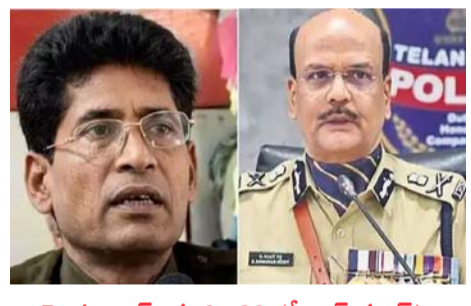
హైదరాబాద్, మార్చి 30 (తీనూర్ న్యూస్): అజ్ఞాతంలో ఉన్న మావోయిస్టులు హింసా మార్గాన్ని విడనాడి, జనజీవన ప్రవృత్తిలో కలిసి గౌరవప్రదమైన జీవితం కొనసాగించాలని తెలంగాణ డిజిపి శివధర్ రెడ్డి - మగతా2లో