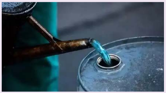
న్యూ ఢిల్లీ, మార్చి 30 (తీనూర్ న్యూస్):

అంతర్జాతీయంగా నెలకొన్న ఉద్దిక్తతల నేపథ్యంలో ఇంధన సరఫరాలో తలెత్తుతున్న ఆటంకాలను దృష్టిలో ఉంచుకుని కేంద్ర ప్రభుత్వం కీలక నిర్ణయం తీసుకుంది. దేశంలోని 21 రాష్ట్రాలు, కేంద్రపాలిత ప్రాంతాలలో ప్రజా పంపిణీ వ్యవస్థ ద్వారా సుపీరియర్ కిరోసిన్ ఆయిల్ పంపిణీ చేసేందుకు అనుమతినిస్తూ - మగతా2లో