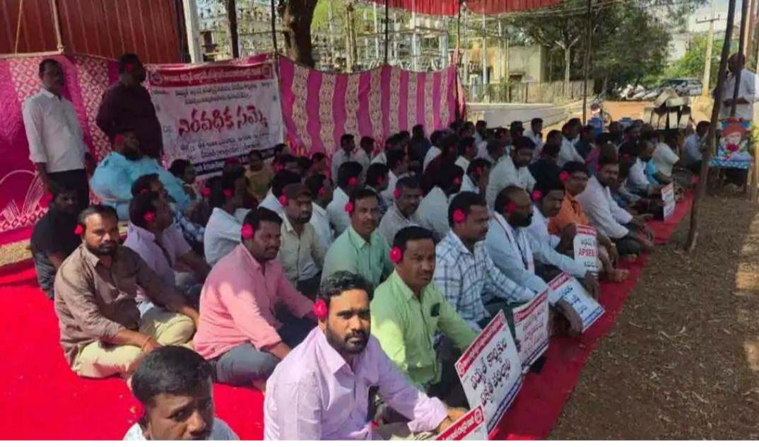
చాలా వరకు సమస్యలు పరిష్కరించే వరకు సమ్మెను కొనసాగిస్తామన్నారు. ఆర్టీజిఎన్ కార్మికుల సమస్యలు పరిష్కరిస్తామని చెప్పి

తమ సమస్యలు పరిష్కరించాలని విద్యుత్ శాఖలో పనిచేస్తున్న ఆర్టీజిఎన్ కార్మికులు ప్రభుత్వాన్ని డిమాండ్ చేశారు. నిరవధిక సమ్మెలో భాగంగా శనివారం జూనియర్ పట్టణంలోని విద్యుత్ శాఖ కార్యాలయ ఆర్టీజిఎన్ కార్మికులు చెవిలో పువ్వులు పెట్టుకొని నిరసన వ్యక్తం చేశారు. ఈ సందర్భంగా పలువురు ఆర్టీజిఎన్ ఎంప్లాయిస్ యూనియన్ నాయకులు, కార్మికులు మాట్లాడుతూ.. కాంగ్రెస్ అధికారంలోకి రాగానే విద్యుత్ శాఖలో పనిచేస్తున్న ఆర్టీజిఎన్ కార్మికుల సమస్యలు పరిష్కరిస్తామని హామీ ఇచ్చి రెండున్నరేళ్లు గడిచినా పట్టించుకోవడంలేదని ఆరోపించారు. ఇప్పటికైనా ప్రభుత్వం విద్యుత్ సంస్థలో ఆర్టీజిఎన్‌లుగా పనిచేస్తున్నారని విద్యార్థులను బట్టి వారికి కనెక్షన్ ఇవ్వాలని పేర్కొన్నారు. కొన్ని సంవత్సరాలుగా చాలీచాలీ వేతనాలతో పనిచేస్తూ ఇబ్బందులు పడుతున్నారన్నారు. ఇప్పటికైనా ప్రభుత్వం వారికి ప్రత్యేక పీఆర్‌సీ ప్రకటించాలని డిమాండ్ చేశారు. కన్యార్థి ఇవ్వాలని, ఏపీఎస్‌కేపీ రూల్స్ ఇవ్వాలని కోరారు. గత ప్రభుత్వం కాంట్రాక్టు కార్మికులను ఆర్టీజిఎన్‌లుగా విభజించారని, దీని వల్ల ఆర్టీజిఎన్లు