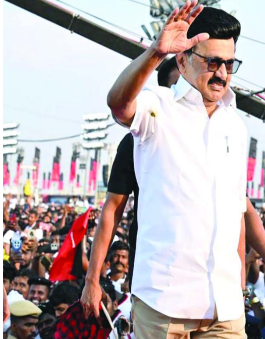
పళనిస్వామిని అన్ని నియోజకవర్గాల్లో ఓడించాలి :

బీజేపీపై తమిళనాడు ముఖ్యమంత్రి, డిఎంకే అధ్యక్షుడు ఎంకే స్థాలిన్ తీవ్ర విమర్శలు గుప్పించారు. బీజేపీ పాలిత రాష్ట్రాల్లో లాగా తమిళనాడులో కుల ఘర్షణలు, మత అల్లర్లు లాంటివి లేవని స్పష్టం చేశారు. ఇతర రాష్ట్రాలతో పోల్చితే తమిళనాడులో శాంతి, భద్రత మెరుగ్గా ఉందన్నారు. బుధవారం తిరుచిరాపల్లి జిల్లాలో జరిగిన బహిరంగ సభలో మాట్లాడుతూ ఈ మేరకు వ్యాఖ్యలు చేశారు. 'ఉత్తరప్రదేశ్ లో ఉన్న మాక దాడులు, మణిపూర్ లో కొనసాగుతున్న అశాంతి తమిళనాడులో లేదు. బీజేపీ పాలిత రాష్ట్రాల్లో కనిపించే పరిస్థితులు ఇక్కడ లేవు. బీజేపీ సృష్టించాలనుకున్న కుట్రలను కూడా మేం అడ్డుకున్నాం. మా ప్రభుత్వ పాలనలో రాష్ట్రంలో శాంతియుత వాతావరణం ఏర్పడింది. అందువల్ల పెట్టుబడులు స్థిరంగా పెరుగుతున్నాయి. దీనికి మద్దతుగా మేం ఎన్నికల ప్రణాళిక, మేనిఫెస్టో విడుదల చేశాం. ప్రకటించిన ప్రతి హామీని అమలు చేస్తాం. మేం చెప్పింది చేస్తాం, చేసినదే చెబుతాం. నేను కరుణానిధి కుమారుడిని' అని స్థాలిన్ తెలిపారు.