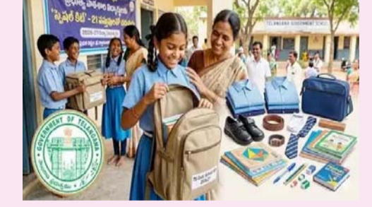
తెలంగాణ ట్యాల్, ఏప్రిల్ 01 (తీవార్ న్యూస్):

అవుతున్నారు. నేను తొక్కుకుంటూ పైకి వచ్చాను అంటూ ముఖ్యమంత్రి చెబుతుంటారు. నిజంగానే నిరుద్యోగుల నెత్తి మీద కాలు పెట్టి తొక్కుకుంటూ మీరు అధికారంలోకి వచ్చారని ఎద్దేవా చేశారు. నోటిఫికేషన్ వేసే వరకు ప్రభుత్వం ఫైల్ చేస్తామని ఇంతమంది నిరుద్యోగుల కన్నీటి గాథలు ఇలా ఉంటే ఎమ్మెల్యేలు, మంత్రులు, సీఎం ఆటలు ఆడుతున్నారంటే నిరుద్యోగుల విషయంలో ఈ ప్రభుత్వం చాలా లైటర్ వే లో ఆలోచిస్తోందని అర్థమవుతోందన్నారు. బాలింతలకు డబ్బులు కిట్?లు బండ్ చేశారు: ఈ ప్రభుత్వం వచ్చాక బాలింతలకు డబ్బులు, కిట్?లు ఇవ్వడం మానేసిందని అంగన్?వాడీలకు జీతాలు కూడా సరిగా ఇవ్వటం లేదన్నారు. ఫీజు రియంబర్స్ మెంట్ కోసం ఏడు వేల కోట్లు ఇవ్వాలి ఉంటే ఇవ్వటం లేదు. కానీ మూసీకి మాత్రం 7 వేల కోట్లు కేటాయించారని ఆరోపించారు. హామీ ఇచ్చిన విధంగా 2 లక్షల ఉద్యోగాలు, జాబ్ క్యాలెండర్ ఎందుకు ఇవ్వటం లేదని ప్రశ్నించారు. 9 నెలల క్రితం పెట్టిన నర్సింగ్ ఎగ్జామ్ ఫలితాలు ఇప్పటి వరకు ఇవ్వలేదని ఇన్ని లక్షల మంది ఎఫ్జెడ్ అయ్యే జీవోల మీద రివ్కాస్ చేసే సమయం ఈ ప్రభుత్వానికి లేదా? అని ప్రశ్నించారు