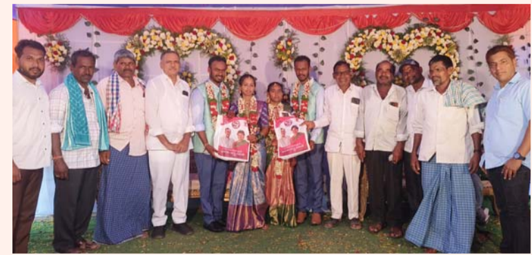
భూపాలపల్లి, ఏప్రిల్ 03 (తీనాగ్రి స్పెషల్):