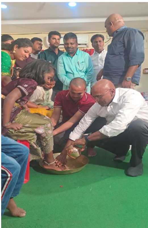
పాల్గొనాలని కోరారు. ప్రేరణలో భాగంగా మనకు ప్రేరణగా నిలిచిన గొప్ప వ్యక్తులను గుర్తుకు తెచ్చుకోవాలని, గత వారంలో మీరు చేసిన పనులను, నేర్చుకున్న విషయాలను గుర్తుకు తెచ్చుకోవాలని తోటి వారితో పంచుకోవాలన్నారు. స్వేరో నాయకులు

ప్రతి పేద వారి ఇల్లు ఒక పాఠశాలగా మారినప్పుడే, సమాజంలో మార్పు సాధ్యమని, జ్ఞాన సమాజ నిర్మాణం సాధ్యమవుతుందని స్వేరో ఫౌండర్ చైర్మన్ డా.ఆర్ఎస్ ప్రవీణ్ కుమార్ తెలిపారు. సిరిసిల్ల పట్టణంలోని సాయిప్రియ ఫంక్షన్ హాల్ లో జరిగిన స్వేరో ఖడ్గధారణ కార్యక్రమానికి ముఖ్య అతిథిగా హాజరయ్యారు. ఈ సందర్భంగా మాట్లాడుతూ, ప్రతి ఇంట్లో తల్లిదండ్రులు ఉపాధ్యాయులు కావాలని, తమ పిల్లలచేత ప్రతి రోజు పుస్తకాలు చదివించాలని పిలుపునిచ్చారు. సమాజంలో మన చుట్టూ ఉండే ప్రకృతి జ్ఞానం కూడా నేర్పాలని కోరారు. వ్యవసాయం, ప్రాజెక్టులు, అడవులు, మ్యూజియం, జీ పార్కు లు చూపించి వాటి గురించి సహజసిద్ధమైన జ్ఞానాన్ని పిల్లలకు అందించాలన్నారు. జ్ఞాన ఖడ్గధారణలో భాగంగా చిన్న పిల్లల కాళ్ళ కడిగి, తలకు కిరీటం పెట్టి, చేతిలో ఖడ్గం, పుస్తకం ఇచ్చి వారిని జ్ఞాన వీరులుగా ప్రకటించారు. స్వేరో జ్ఞాన ఖడ్గధారణ కార్యక్రమంలో జ్ఞాన ఖడ్గ ధారణ ఒక భాగమన్నారు. మహాత్మా జ్యోతిబా పూలే, బాబా సాహెబ్ అంబేద్కర్ మహానీయుల కలలు సాకారం కావాలంటే జ్ఞాన సమాజ నిర్మాణం కావాలన్నారు. జ్ఞాన సమాజం నిర్మాణం కావాలంటే ప్రతి ఇంట్లో పూజ గదితో పాటు పుస్తకాల గది ఉండాలన్నారు. ప్రతి ఇంట్లో తల్లిదండ్రులు పిల్లలను రోజూ చదివించాలని సూచించారు. అంతేకాకుండా ప్రతి శనివారం సాయంత్రం 6 గం.లకు జరిగే ప్రేరణ కార్యక్రమంలో