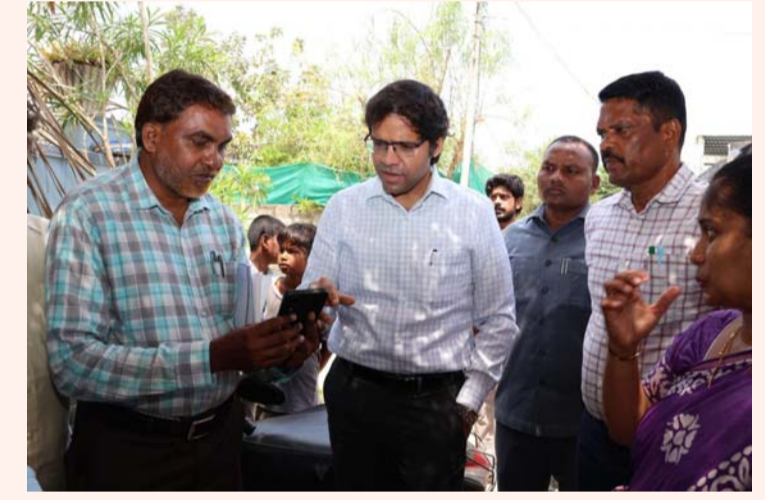
జనగామ జిల్లా, ఏప్రిల్ 03 (తీవ్రార్ న్యూస్):