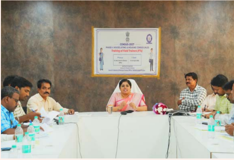
మహబూబాబాద్ జిల్లా, ఏప్రిల్ 03 (తీనాగ్రి స్పెషల్):

శుక్రవారం భారతి హోటల్లో, డైరెక్టర్ జనాభా లెక్కల అధికారి హైదరాబాద్ గారు జిల్లాలో జరుగుచున్న జనాభా లెక్కల ఏర్పాట్లు పరిశీలించారు. ఇందులో భాగంగా మండల స్థాయి మాస్టర్ శిక్షణ అధికారుల సమావేశానికి హాజరు కావడం జరిగినది. శిక్షణ పొందుతున్న అధికారులకు తగు సూచనలు చేశారు. ఈ సందర్భంగా డైరెక్టర్ జనాభా లెక్కల అధికారి మాట్లాడుతూ ప్రభుత్వం సూచించిన విధముగా నిబంధన ప్రకారం క్షేత్రస్థాయిలో అధికారులు పక్కా సర్వే నిర్వహించి జనాభా గణన చేయాలని, ప్రభుత్వం అభివృద్ధి సంక్షేమ పథకాలు, మౌలిక వసతులు, ప్రణాళికలు రూపొందించడానికి జనాభా గణాంకాలు కీలకంగా ఉంటాయన్నారు. ఈ గణన దేశంలో మొదటిసారిగా డిజిటల్ విధానం ద్వారా మొబైల్ యాప్, వెబ్ పోర్టల్ ను ఉపయోగించి ఈ సర్వేను నిర్వహిస్తున్నట్లు తెలిపారు. ప్రజలు తమ వివరాలను తామే స్వయంగా నమోదు చేసుకునేందుకు ప్రత్యేక పోర్టల్ ను జనాభా గణన ప్రారంభానికి ముందు అందుబాటులోకి తీసుకువస్తామని తెలిపారు. జనాభా లెక్కల గణనలో మండల స్థాయి శిక్షణ అధికారులకు తగిన సూచనలు చేసి, శిక్షణను సద్వినియోగం చేసుకొని తిరిగి వారు మండలలోని ఎన్నుమరేఖల ద్వారా సూపర్ వైబ్రేటర్ల శిక్షణ ఇచ్చి జనాభా లెక్కల కార్యక్రమాన్ని విజయవంతం చేయవలసిందిగా కోరారు.