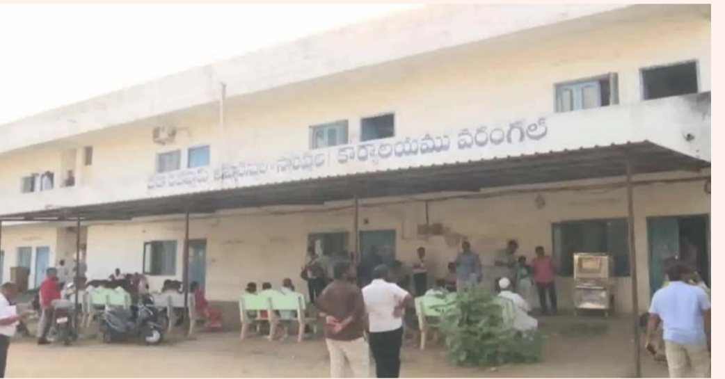
వరంగల్, ఏప్రిల్ 03 (తీనాగ్రి స్పెషల్):

అవినీతి అధికారుల భరతం పట్టించుకు ఏసీబీ (అవినీతి నిరోధక శాఖ) అధికారులు కొరడా ఝుళిపించారు. రిజిస్ట్రేషన్ పేరుతో అక్రమాలకు పాల్పడుతున్నారన్న పక్కా సమాచారంతో హన్మకొండలోని వరంగల్ సబ్ రిజిస్ట్రార్ కార్యాలయంతో పాటు, ఆ శాఖ అధికారులకు చెందిన ఖమ్మంలోని ఇళ్లపై ఏసీబీ అధికారులు ఏకకాలంలో దాడులు నిర్వహించారు. గురువారం ప్రారంభమైన ఈ తనిఖీలు శుక్రవారం వరకు ఏకదాటిగా కొనసాగాయి. ఈ దాడుల్లో కళ్లు చెదిరే