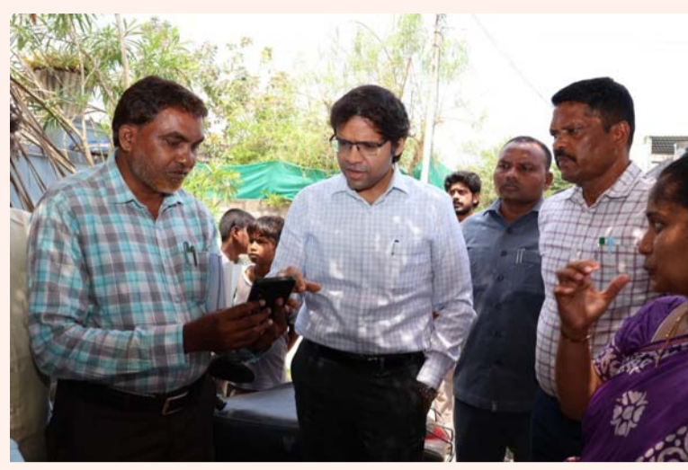
భద్రాద్రి కొత్తగూడెం జిల్లా, ఏప్రిల్ 03 (తీవ్రార్ న్యూస్):