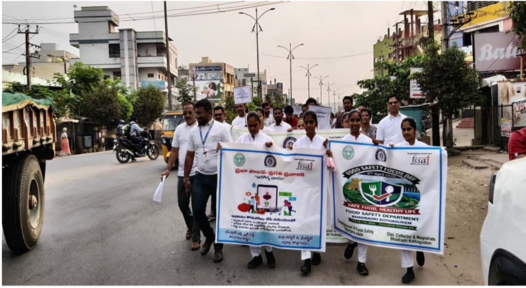
అందించారు. టీసీ, ఎస్సీ, ఎస్టీ వసతి గృహాల వంట కార్యకర్తలకు ప్రత్యేక శిక్షణ కార్యక్రమం నిర్వహించి, పోషకాహారం తయారీ, పరిశుభ్రత ప్రమాణాలు, ఆహార భద్రతా నియమాలపై సమగ్ర అవగాహన కల్పించారు. అనంతరం రిజిస్ట్రేషన్ పత్రాలు అందజేశారు.