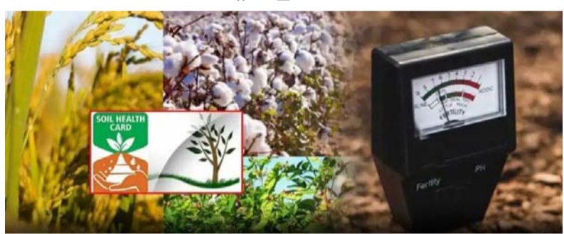
హైదరాబాద్, ఏప్రిల్ 06 (తీనార్ న్యూస్):

భూసార పరీక్షల ఆధారంగా రైతులకు పంటల ఎంపికపై స్పష్టమైన మార్గదర్శకాలు అందించేందుకు ప్రభుత్వం భూసార హెల్త్ కార్డును కీలకంగా తీసుకొస్తోంది. ఈ కార్యక్రమాన్ని క్షేత్రస్థాయిలో సమర్థవంతంగా అమలు చేయడానికి వాలంటీర్లకు ప్రత్యేక శిక్షణ ఇవ్వనుంది. మొదటి హైలెట్ ప్రాజెక్టు కొడంగల్ నియోజకవర్గంలో 128 మంది వాలంటీర్లకు ఈ నెల 6న ఇక్లికాట్ లో ట్రైనింగ్ నిర్వహించనున్నారు. మట్టి నమూనాల సేకరణలో పాటించాల్సిన పద్ధతులు, విశ్లేషణ విధానాలపై పూర్తిస్థాయి అవగాహన కల్పించనున్నారు. అనంతరం ఈ నెల 8 నుంచి వ్యవసాయ విశ్వవిద్యాలయంలో మరో 1000 మందికి శిక్షణ తరగతులు ప్రారంభం కానున్నాయి. దశలవారీగా మొత్తం 30 వేల మంది వాలంటీర్లకు శిక్షణ పూర్తి చేసి, గ్రామాల వారీగా పంపాలని వ్యవసాయ శాఖ ప్రణాళికలు సిద్ధం చేసింది. మట్టి నమూనాలు సేకరించే సమయంలో జియో ట్యాగింగ్ వంటి ఆధునిక విధానాలను కూడా వినియోగించనున్నారు. శిక్షణ పొందిన వాలంటీర్లు గ్రామాలలో రైతులకు అందుబాటులో ఉండి సాగు సలహాలు ఇవ్వనున్నారని అధికారులు చెప్పారు. ముఖ్యంగా భూసార హెల్త్ కార్డులు ఈ కార్యక్రమంలో కీలక పాత్ర పోషించనున్నాయి. మట్టి పరీక్ష ఫలితాల ఆధారంగా ఏ పంటలు వేస్తే ఎక్కువ వస్తుందో స్పష్టంగా సూచనలు ఇవ్వనున్నారు. రసాయనిక ఎరువుల అధిక వినియోగంతో భూమి నిస్సారమవుతున్న తరుణంలో ఈ నివేదికలు రైతులకు దిక్పాటిలా పని చేస్తాయని అధికారులు పేర్కొంటున్నారు. భూమిలో ఉన్న పోషకాల స్థాయిని తెలుసుకోవడం వల్ల అవసరానికి మించి యూరియా, డిఎపీ వంటి ఎరువులు వాడాలైన అవసరం తగ్గతుంది. దీంతో రైతుల పెట్టుబడి ఖర్చులు గణనీయంగా తగ్గే అవకాశం ఉంది. ముఖ్యంగా సూర్య పోషకాలైన జింక, బోరాన్, ఇనుము వంటి లోపాలను గుర్తించి సరిచేయడం వల్ల పంట నాణ్యత, దిగుబడి పెరుగుతుందని అధికారులు చెబుతున్నారు.