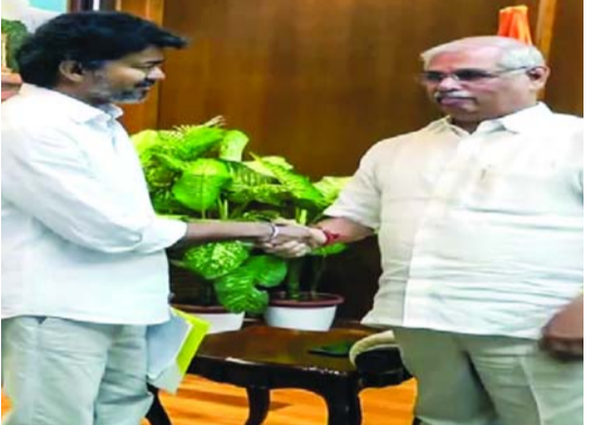
వారు గుర్తు చేశారు. టీపీకే ప్రభుత్వాన్ని ఏర్పాటు చేసే విషయంలో, గవర్నర్ బీజేపీకి పక్షపాతంగా వ్యవహరిస్తున్నారని ఆరోపించారు. గవర్నర్ కు వ్యతిరేకంగా పక్షాధ్యక్షులు ప్రదర్శనలు నిరసన వ్యక్తం చేశారు. గురువారం విజయ్ ప్రమాణ స్వీకారం చేయలేకపోయినందున తాము నిరాశ చెందామని, అయితే, విజయ్ ప్రభుత్వం ఏర్పాటు అయ్యేవరకు చెన్నైలోనే ఉండిపోవాలని నిర్ణయించుకున్నట్లు టీపీకే కార్యకర్తలు తెలిపారు.

తమిళనాడులో రాజకీయాలు ఉత్సాహభరితంగా మారాయి. ప్రభుత్వ ఏర్పాటు గవర్నర్ అంగీకారం తెలుపలేదని అంతకుముందు వార్తా కథనాలు వెలువడ్డాయి. 118 మంది ఎమ్మెల్యేల మద్దతు ఉందని నిరూపించాలని గవర్నర్ విజయ్ కు సూచించినట్లు రాజకీయ వర్గాల్లో చర్చ జరిగింది. అయితే, ఆ వార్తలపై లోక్ భవన్ తాజాగా (ఫైనల్) వివరాల చేసింది. అందులో, ప్రభుత్వం ఏర్పాటుకు మెజారిటీ చూపాల్సిన అవసరాన్ని విజయ్ కు గవర్నర్ వివరించారని పేర్కొంది. “ఇవాళ గవర్నర్ ఆర్డర్లతో విజయ్ భేటీ అయ్యారు. మెజారిటీ కనిపించడం లేదని వివరించారు. మెజారిటీతోనే రాజ్యాన్ని గవర్నర్ సూచించారు” అని లోక్ భవన్ అధికారిక ప్రకటనలో వెలువడింది.