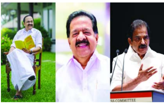
ఎన్నికల్లో కేరళలోని అలప్పుక లోక్సభ స్థానం నుంచి గెలిచారు. లోక్సభకు ఎన్నికవ్వడానికి ముందు ఆయన రాజస్థాన్ నుంచి రాజ్యసభ సభ్యునిగా ఉండేవారు.